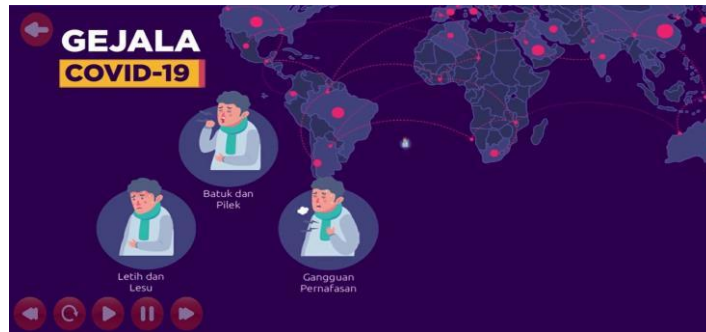
Gambar 8 Tampilan Protokol Kesehatan

Tampilan ini adalah tampilan edukasi pencegahan covid-19 user dapat melihat video pencegahan covid bagaimana caranya untuk mencegah virus covid-19.