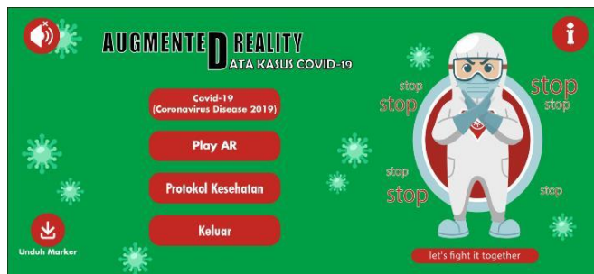
Gambar 2 : Tampilan menu home

Pada tampilan ini, user dapat memilih tombol Covid-19, Play AR , Protokol Kesehatan dan tombol-tombol yang ada ditampilkan menu home . Pada menu Covid-19 user dapat melihat materi tentang coronavirus disease 2019 , menu Play AR user dapat melihat 3D peta wilayah yang didalamnya berisi informasi tentang data kasus covid-19, pada menu protokol kesehatan user dapat melihat video edukasi pencegahan covid.