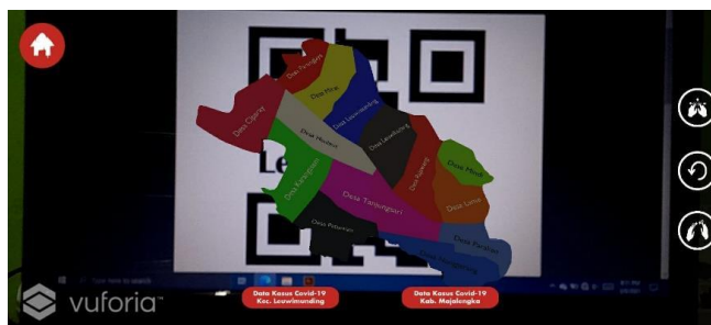
Gambar 4 Tampilan 3D Peta Leuwimunding