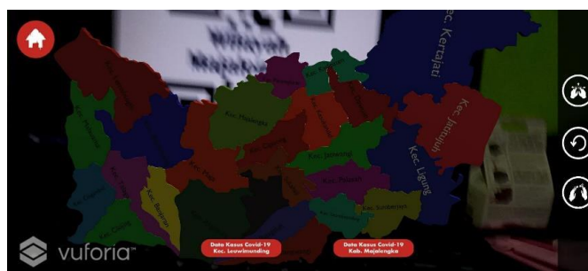
Gambar 5 Tampilan 3D Peta Majalengka

Pada tampilan Play AR , user akan melihat objek 3D peta wilayah dan di bawahnya ada 2 button yaitu button data kasus wilayah Leuwimunding dan wilayah Majalengka dan tampilannya adalah sebagai berikut :