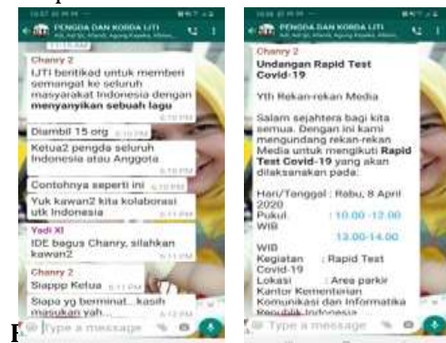
Figure 2. Diskusi Grup WhatsApp PENGDA dan KORDA IJTI sebagai fungsi motivasi

Di tengah sulitnya keadaan, pengurus daerah melakukan beragam kegiatan. Kendati sederhana seperti membagikan masker, namun seluruh anggota grup chat saling memberi apresiasi. Apresiasi ini mendorong pengurus lainnya untuk melakukan hal serupa atau bahkan lebih, baik secara kuantitas maupun kualitas. Dengan hal-hal tadi, maka grup chat bisa menjadi salah satu tempat untuk aktualisasi diri.