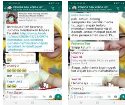
Figure 3. Diskusi Grup WhatsApp PENGDA dan KORDA IJTI sebagai fungsi emosional

Emosi harus mendapat perhatian agar jalannya organisasi dalam mencapai tujuan bisa tercapai. Emosi memiliki fungsi positif mendorong banyak perubahan bila dikelola dengan baik. Emosi juga merupakan komponen yang penting dalam motivasi (Frijda, 1986) sebab akan menggerakkan individu untuk berperilaku tertentu.