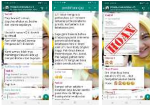
Figure 1. Diskusi Grup WhatsApp PENGDA dan KORDA IJTI sebagai fungsi kontrol

jurnalistik yang aman. Aman dalam proses peliputan, maupun penayangannya. Kontrol ini menjadi sangat penting karena IJTI adalah salah satu motor penggerak, penjaga agar karya jurnalistik di Indonesia bermanfaat bagi publik.