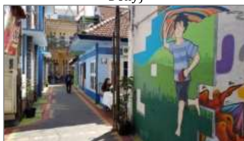
Gambar 1. Suasana Lingkungan Kampung Kota Surabaya (Kampung Ketandan, Kampung Pecinan, Kampung Candirejo dan Kampung Dolly)