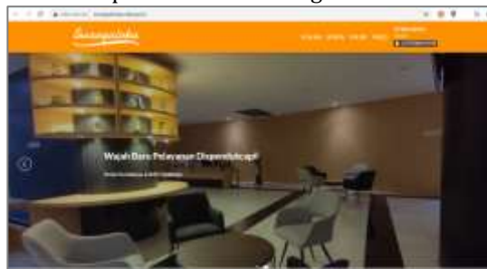
Gambar 3. Tampilan Website Swargaloka

Untuk mendukung aktivitas Swargaloka, Dispendukcapil yang berkantor di lantai 2 Gedung Mall Pelayanan Publik di Jalan Tunjungan menyediakan studio siaran, ruang redaksi dan lounge untuk siaran Podcast, seperti dapat dilihat pada gambar 4 di bawah ini.